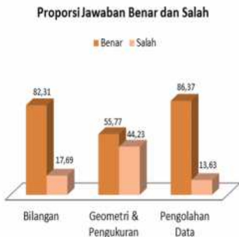
Gambar 4. Proporsi Jawaban Benar dan Salah untuk Tiap Materi

Penemuan jenis kesalahan dan penyebabnya didasarkan pada respon yang diberikan oleh peserta tes. Identifikasi kesalahan peserta ujian difokuskan pada atribut-atribut yang tidak dikuasai dan tidak diterapkan dengan tepat. Kesalahan peserta ujian dapat diketahui dari respon yang diberikan pada setiap butir soal. Jenis kesalahan yang dilakukan oleh siswa diklasifikasikan menjadi 9 jenis: (1) kesalahan konsep, (2) kesalahan interpretasi bahasa, (3) kesalahan prosedur, (4) kesalahan berhitung, (5) kesalahan penafsiran, (6) kesalahan interpretasi bahasa dan berhitung, (7) kesalahan prosedur dan berhitung, (8) kesalahan interpretasi bahasa dan prosedur, dan (9) kesalahan konsep dan penafsiran. Berikut disajikan pada Gambar 5 persentase jenis kesalahan siswa tiap materi.