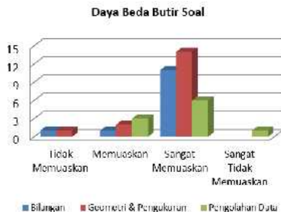
Gambar 3. Daya Beda Butir Soal untuk Tiap Materi

Berdasarkan Gambar 3, dapat dilihat bahwa materi pengolahan data saja yang mempunyai daya beda dengan kategori sangat tidak memuaskan, sedangkan daya beda dengan kategori tidak memuaskan dimiliki oleh materi bilangan, geometri dan pengukuran. Daya beda dengan kategori memuaskan dan sangat memuaskan dimiliki oleh ketiga materi tersebut.