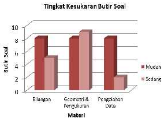
Gambar 2. Tingkat Kesukaran Butir Soal untuk Tiap Materi

Selain tingkat kesukaran, karakteristik butir soal juga ditentukan oleh daya beda. Berikut hasil rekapitulasi untuk daya beda butir soal disajikan dalam Gambar 3.