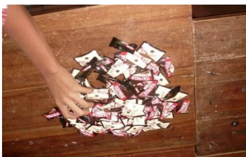
Gambar 4. Permen Dikumpulkan kembali di atas Meja

Guru menyampaikan, "Anak-anak, karena telah terjadi ketidakadilan, sekarang silakan permennya dikumpulkan kembali". Anak-anak menyahut "huu.... huuu...huuu..". Kemudian, para siswa mengumpulkan permen yang berhasil direbutnya tadi, diletakkan pada meja (Gambar 4).