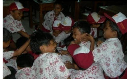
Gambar 2. Siswa Berebut Permen

lain tanpa menggunakan peraturan. Gambar 2 menunjukkan situasi kesemrawutan dan kekacauan. Siswa sedang berebut permen secara bebas. Seorang anak menangis karena tangannya keinjak sepatu temannya. Anak lain tersenyum kecut karena sudah berupaya merebut permen tetapi tidak memperolehnya. Ada juga ada anak yang tertawa-tawa, karena memperoleh segenggam permen.