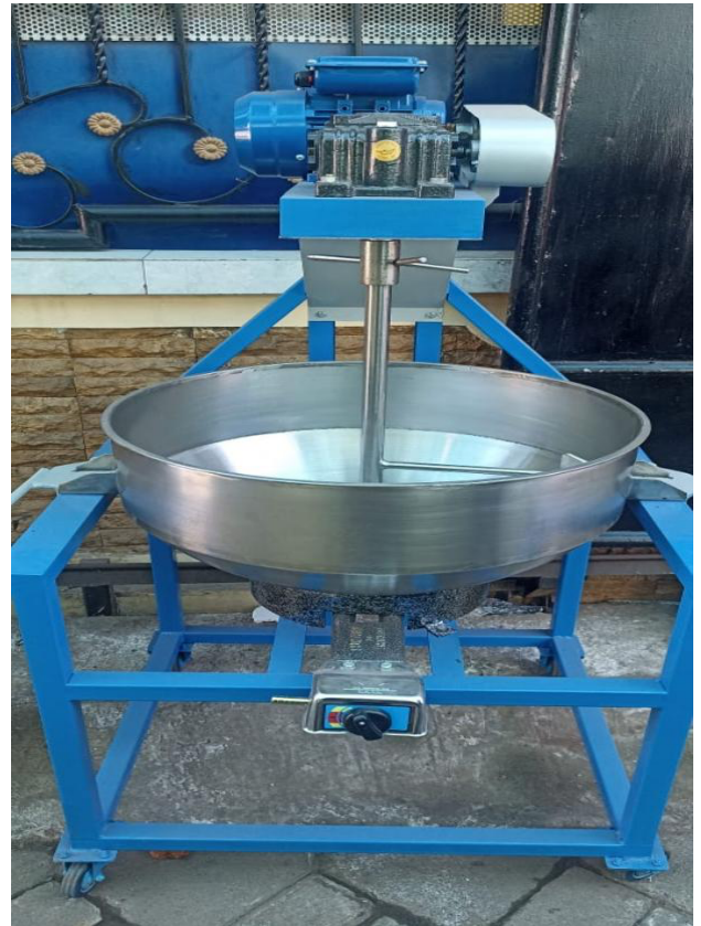
Gambar 2. Mesin Pengaduk

Keterbatasan sumber daya manusia (SDM) menjadi salah satu hambatan utama, karena proses produksi masih ditangani oleh tenaga kerja dalam jumlah terbatas. Hal ini berdampak pada distribusi kerja yang kurang optimal dan berpotensi menahan laju ekspansi usaha. Selain itu, strategi pemasaran masih cenderung konvensional dengan mengandalkan pasar lokal, sementara peluang pemanfaatan pemasaran digital melalui e-commerce, media sosial, maupun jaringan kemitraan modern belum digarap secara maksimal.