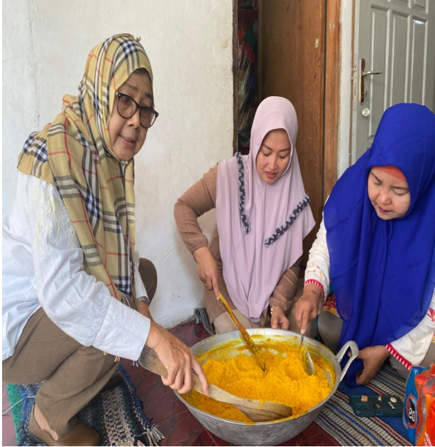
Gambar 3. Produk jadi setelah menggunakan mesin

konten sederhana di media sosial, seperti Instagram dan Facebook, yang bertujuan memperkenalkan produk secara lebih luas. Namun, hasil yang diperoleh masih memerlukan usaha pendampingan lebih lanjut karena mitra belum sepenuhnya mampu menghasilkan konten yang menarik dan konsisten untuk meningkatkan daya tarik konsumen. Pemanfaatan e-commerce juga belum optimal, sehingga penjualan masih bergantung pada order konvensional dari lingkungan sekitar.