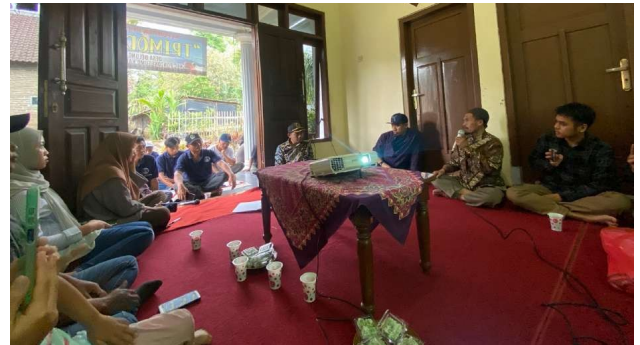
Gambar 2. Kegiatan Diseminasi Akad Transaksi Limbah Ternak Secara Halal

Keduanya hampir mirip, tetapi terdapat sedikit perbedaan. Akad Ibahah memperbolehkan siapapun (tanpa terkecuali) mengambil objek yang dihibahkan. Akan tetapi, akad hibah merupakan akad pemberian, dimana subjek/tujuan pemberiannya jelas.