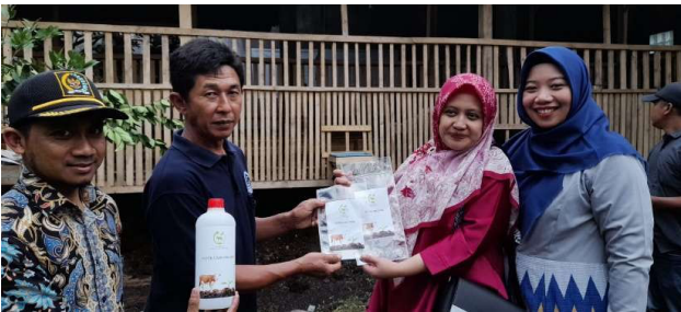
Gambar 4. Pemberian Starter Pack untuk Pupuk Padat pada Kelompok Ternak Trimodadi

kualitas pupuk serta menarik konsumen. Pemilihan packaging yang tepat dapat mencegah terjadinya kerusakan formulasi bakteri pada pupuk organik (Safutra, 2022). Di dalam pelatihan tersebut, Tim Pengabdian FEB UM memberikan starter pack dan stiker branding kepada Kelompok Ternak Trimodadi agar pengemasan terlihat lebih menarik. Packaging starter pack yang diberikan dalam bentuk plastik zip lock yang berfungsi untuk melindungi pupuk organik dari kontaminasi lingkungan yang dapat merusak kualitas pupuk. Pada kemasan tersebut juga telah diberikan stiker branding yang mempermudah konsumen dalam memahami manfaat produk dan cara pengaplikasian pupuk hasil olahan limbah ternak tersebut.