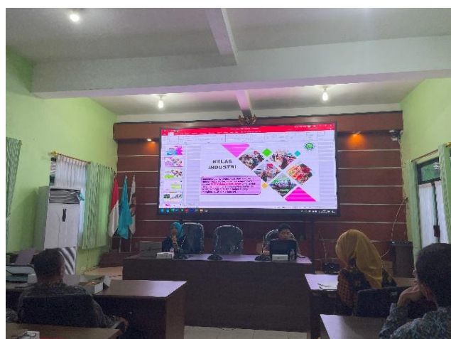
Gambar 3. Penyampaian materi pengenalan book creator

Kegiatan awal dilaksanakan dengan penyampaian materi terkait pentingnya pemanfaatan teknologi dalam pembelajaran, pengenalan book creator, serta cara dan langkah-langkah membuat E-book based project . Dalam pengenalan Book Creator ini sebagai bekal dan tambahan informasi kepada peserta sebelum melaksanakan praktik pembuatan. Kemudian, kegiatan dilanjutkan dengan praktik pembuatan E-book based project dengan didampingi oleh pemateri dan tim pengabdian.