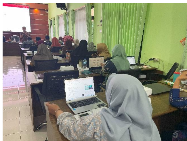
Gambar 4. Pelaksanaan praktik pembuatan E-book based project

book yang berisi kolaborasi materi ajar antar bidang mata pelajaran yang nantinya akan dituangkan dalam E-book based project . Setiap guru mempraktikkan langkah-langkah pembuatan e-book dengan didampingi secara langsung oleh tim pengabdian. Hasil dari praktik pembuatan ini berupa E-book based project yang memuat kolaborasi materi ajar antar bidang mata pelajaran berdasarkan kreativitas dan keterampilan.