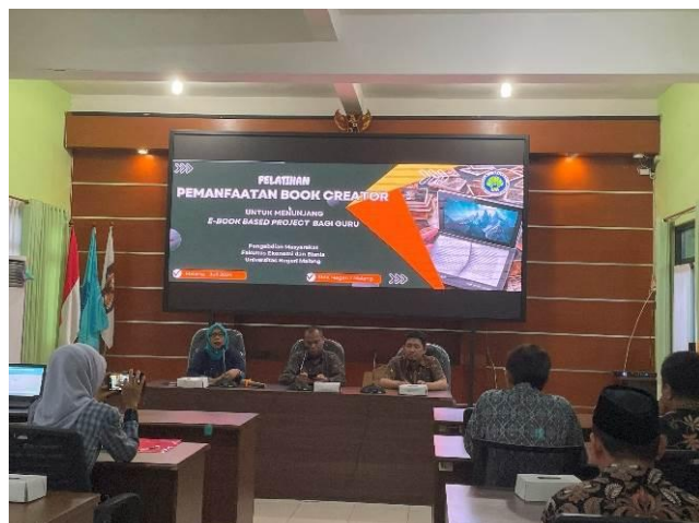
Gambar 2. Perkenalan tim pengabdian

Sonokembang, Bandungrejosari, Kec. Sukun, Kota Malang, Jawa Timur 65148. Peserta kegiatan ini merupakan seluruh jajaran guru dari berbagai program keahlian yang ada di SMK Negeri 1 Malang yang berjumlah sekitar 103 guru. Terselenggaranya kegiatan pengabdian ini mendapatkan sambutan hangat dan antusiasme yang tinggi oleh pihak SMK Negeri 1 Malang.