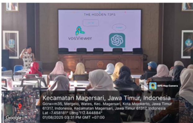
Gambar 1. Pemaparan Materi Mengenai AI

Evaluasi terhadap kualitas integrasi pedagogis kecerdasan buatan dalam pembelajaran dilakukan melalui analisis produk pembelajaran yang dikembangkan guru menggunakan rubrik yang mengukur lima dimensi kualitas: relevansi dengan tujuan pembelajaran, kesesuaian dengan karakteristik siswa, kreativitas dalam pemanfaatan teknologi, pertimbangan etis, dan potensi dampak terhadap pembelajaran siswa. Hasil analisis terhadap 120 sampel produk pembelajaran menunjukkan distribusi kualitas yang beragam, dengan 23% produk dikategorikan sangat baik, 48% baik, 24% cukup, dan 5% masih memerlukan perbaikan signifikan.