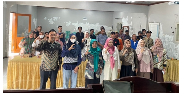
Gambar 8. Foto bersama tim pengabdian UM dengan peserta dari warga desa Padusan

Sebelumnya desa Padusan memang sudah pernah menerapkan aplikasi Siskeudes untuk keuangan desa, namun hanya pemegang akun saja yang dapat menguasai aplikasi tersebut, sehingga untuk awal pelatihan literasi keuangan digital sebelum masuk ke aplikasi yang nanti dapat dikembangkan, maka para calon pengurus koperasi desa Merah Putih diberikan pelatihan untuk mencatat keuangan dengan excel. Sumber daya manusia yang memadahi dalam perencanaan awal koperasi.