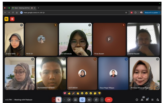
Gambar 5. Perencanaan pelaksanaan oleh Tim Pengabdian UM dan perwakilan desa Padusan

Analisis permasalahan yang telah dilakukan menunjukkan bahwa diperlukan pelatihan tentang literasi keuangan digital dalam rangka mempersiapkan koperasi Merah Putih di Padusan, sehingga diperlukan perencanaan yang matang dalam rangka pelatihan tersebut. Perencanaan pelaksanaan dilakukan secara online melalui platform Google Meet oleh tim pengabdian Universitas Negeri Malang bersama dengan Ibu Ninik sebagai perwakilan desa Padusan. Sesuai dengan topik permasalahan, maka tim pengabdian memutuskan untuk memilih bapak Slamet Fauzan dosen Akuntansi Universitas Negeri Malang sebagai pemateri, karena beliau adalah pakar dari akuntansi desa.