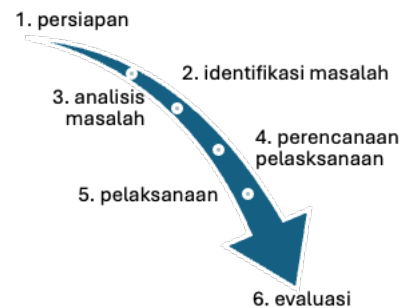
Gambar 2. Tahapan pengabdian masyarakat di Padusan dengan metode PRA

Pengabdian kepada Masyarakat ini dilakukan di Desa Padusan, Mojokerto, Jawa Timur oleh tim Pengabdian Universitas Negeri Malang dengan metode pelaksanaan pengabdian kepada masyarakat ini menggunakan metode Participatory Rural Appraisal (PRA) , yaitu dengan melibatkan masyarakat desa Padusan khususnya calon pengurus koperasi Merah Putih secara langsung dari setiap tahap dalam pengabdian (Hamdy et al. 2024; Hidayana et al. 2019). Tahap – tahap dari metode pengabdian masyarakat yang telah dilakukan antara lain, (1) persiapan; (2) identifikasi masalah; (3) analisis masalah; (4) perencanaan pelaksanaan; (5) pelaksanaan; (6) evaluasi.