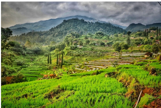
Gambar 1. Desa Padusan, Mojokerto, Jawa Timur

Desa Padusan, Mojokerto, Jawa Timur Padusan terletak di wilayah Kecamatan Pacet, Kabupaten Mojokerto, Provinsi Jawa Timur. Desa ini berada di kawasan pegunungan dengan ketinggian sekitar 800 meter di atas permukaan laut, sehingga memiliki udara yang sejuk dan segar. Selain itu, desa ini juga menjadi destinasi wisata populer berkat adanya pemandian air panas alami yang menjadi daya tarik utama (Purwadinata and Ambarwati 2023). Dengan daya tarik wisata yang begitu kuat, maka desa Padusan ini berpotensi mendapatkan pendapatan yang cukup untuk masyarakatnya. Hal tersebut karena salah satu faktor yang mempengaruhi minat destinasi para wisatawan adalah citra destinasi (Yandi, Mahaputra, and Mahaputra 2023). Berdasarkan dari hal tersebut, maka diharapkan melalui koperasi desa Merah Putih, masyarakat khususnya pengurus koperasi desa Merah Putih di Padusan, dapat mengelola keuangan secara digital dengan maksimal. Pengeleloaan keuangan di koperasa desa Merah Putih diperlukan literasi keuangan digital untuk mendukung pengelolaan keuangan di koperasi desa tersebut. Pengelolaan keuangan yang baik, dapat memaksimalkan kemajuan pada entitas bisnis (Rahmawati, Maharani, and Islamiyati 2024).