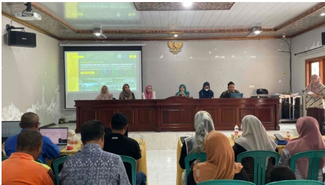
Gambar 6. Pembukaan Pengabdian oleh Tim Pengabdian UM dan Kepala Desa Padusan

Pengabdian dalam bentuk pelatihan literasi keuangan digital ini berhasil menumbuhkan literasi keuangan digital para calon pengurus koperasi dalam rangka persiapan koperasi desa Merah Putih. Sebelum adanya pelatihan, mayoritas calon pengurus masih minim pemahaman tentang pengelolaan keuangan koperasi dengan menggunakan ICT atau digital. Untuk membentuk kemajuan dan kesejahteraan suatu desa, diperlukan adanya inovasi yang harus melibatkan masyarakat desa tersebut (Wulandari et al. 2025).