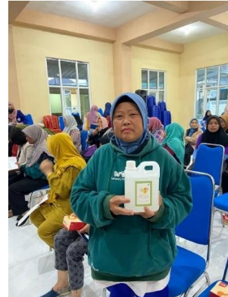
Gambar 4. Foto Peserta Pelatihan Pengawet Bunga Desa Sumberbrantas dengan Produk

kelapa dan citric acid dinilai sangat efektif. Hal ini dapat dilihat dari respon pelatihan yang sangat antusias mengikuti kegiatan. Salah satu peserta mengatakan “Pelatihan ini sangat menambah wawasan kami untuk menambah umur bunga, selain untuk skala industri, saya sebagai Ibu Rumah Tangga sangat terbantu untuk bereksperimen dengan pengawet ini pada bunga di ruang tamu rumah saya”.