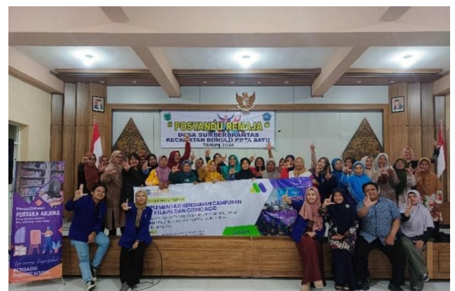
Gambar 5. Kegiatan Pelatihan di Desa Sumberbrantas

Respon masyarakat Desa Sumberbrantas terhadap topik pelatihan ini sangat memuaskan. Peserta pelatihan sebelumnya belum mengetahui tentang potensi air kelapa dan citric acid sebagai pengawet dan hanya menggunakan air dan gula sebagai larutan untuk menyimpan bunga potong. Peserta pelatihan sangat senang mendapatkan keterampilan baru dan memberikan feedback pengetahuan ini bermanfaat terutama untuk mempertahankan usaha bunga potong bertahan dan sustain .