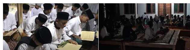
Gambar 3. Observasi Kegiatan Pembelajaran Santri Pondok Pesantren Nurul Yaqin Gunung Sari

Pondok Pesantren Nurul Yaqin Gunung Sari merupakan yayasan lembaga pendidikan berbasis pesantren terintegrasi dengan pendidikan formal mulai dari Raudhatul Athfal hingga Madrasah Aliyah. Pondok ini terletak di Desa Badung, Kecamatan Proppo, Kabupaten Pamekasan, Jawa Timur yang bernaung di bawah Kementerian Agama yang saat ini memiliki kurang lebih 2000 santri dan 70 guru. Luas keseluruhan pondok ini kurang lebih seperempat dari Desa Badung. Berdasarkan hasil observasi ditemukan bahwa mitra menghadapi tantangan berupa rendahnya life skill pada santri jenjang Madrasah Aliyah sebagai bekal untuk menghadapi tantangan global. Lebih spesifik, life skill yang dimaksud ialah ketidaktahuan santri tentang pengetahuan moderasi beragama dalam menyikapi perbedaan keyakinan antar umat sesama agama maupun lintas agama, minimnya wawasan dan keterampilan siswa dalam desain grafis, teknologi dasar, dan pemahaman mengenai Artificial Intelligence (AI). Setelah itu, dilakukan observasi lingkungan pondok pesantren untuk mengumpulkan data tambahan seperti kegiatan pembelajaran para santri sehari-hari.