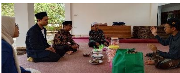
Gambar 1. Wawancara dengan Pihak Pondok Pesantren Nurul Yaqin Gunung Sari

Kegiatan yang dilakukan pada tahap pertama ini ialah identifikasi kondisi mitra melalui kegiatan observasi dan wawancara. Langkah ini bertujuan untuk mengetahui kebutuhan dan problematika yang dialami oleh mitra sehingga solusi yang tepat diberikan (Zunaidi, 2024). Sebelum kegiatan identifikasi, pihak terkait melakukan perizinan dan persetujuan dengan mitra secara daring. Kemudian, wawancara dilakukan kepada pimpinan Pondok Pesantren Nurul Yaqin Gunung Sari yang memahami kondisi mitra secara detail dan mendalam.