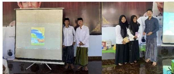
Gambar 10. Sesi Presentasi Desain Poster dan Pemberian Hadiah