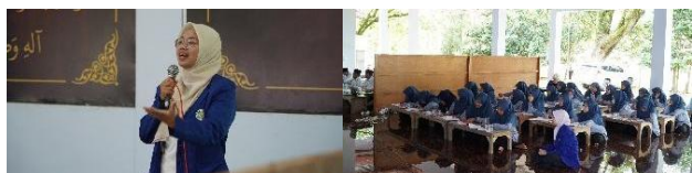
Gambar 8. Penyampaian materi perencanaan karir

dapat menyelesaikan masalah karir sampai tuntas (Zuroida et al., 2024). Terdapat pertimbangan yang diperlukan untuk menentukan karir yaitu kemampuan, minat, dan kepribadian masing-masing individu. Bahkan mereka hanya cenderung mengikuti pilihan orang tua atau teman tanpa identifikasi alasan yang jelas dan hanya berdasar pada popularitas. Hal tersebut tentu dapat menjadi hambatan bagi santri untuk mengembangkan karirnya. Maka dari itu, melalui materi ini, diharapkan santri dapat memiliki landasan yang kuat untuk menentukan karirnya.