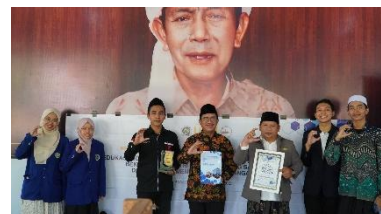
Gambar 6. Penyerahan Simbolis Produk Pengabdian

oleh dosen PAI dari Universitas Negeri Malang sekaligus ketua tim pengabdian masyarakat Insan Berdaya. Dilanjutkan dengan diskusi kasus moderasi beragama bersama para santri untuk menumbuhkan kemampuan berpikir kritis dan problem solving. Kegiatan berikutnya penyampaian materi dan pelatihan life skill yang dilakukan oleh mahasiswa.