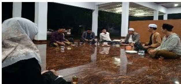
Gambar 4. Rapat Persiapan Program bersama Mitra

Selanjutnya, diperlukan persiapan untuk mengimplementasikan solusi yang ditentukan, yaitu dengan menyusun keperluan selama program Insan Berdaya berlangsung, seperti lokasi, waktu, susunan acara, dan sarana prasarana. Hal ini dilakukan untuk membantu maksimalnya proses program pengabdian, meningkatkan partisipasi mitra, dan mengoptimalkan dampak dari program yang diselenggarakan (Zunaidi, 2024).