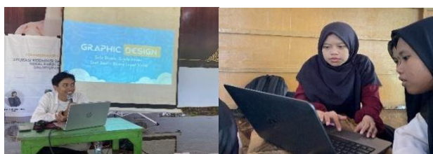
Gambar 9. Pelatihan Desain Grafis

Pada hari kedua, dilaksanakan pelatihan desain grafis berbasis project based learning (pjbl) menggunakan aplikasi canva. Alasan dipilihnya aplikasi Canva sebagai media pelatihan ialah tersedianya beragam desain dan template yang menarik sehingga informasi yang disampaikan tidak terkesan monoton dan membosankan (Pelangi, 2020). Selain itu, model project based learning dalam pelatihan ini juga dapat memberikan pengalaman langsung bagi siswa di kehidupan nyata sehingga dapat meningkatkan pemahaman, komunikasi, soft skill , keterampilan kepemimpinan, mendorong terwujudnya etika spiritual, dan membentuk jati diri bangsa (Sutrisno & Syukur, 2023). Pelatihan diawali penyampaian tutorial dan pengenalan fitur canva oleh pemateri. Kemudian para santri berpasangan menggunakan satu laptop untuk menyelesaikan project berupa poster bertema Idul Adha yang dipresentasikan untuk dinilai. Para santri pun antusias berkreasi sesuai imajinasi. Mahasiswa yang tidak memberikan materi, membantu para peserta yang membutuhkan bantuan mengoperasikan aplikasi Canva. Poster yang telah dibuat kemudian dikumpulkan dan dipresentasikan detail desainnya. Perwakilan guru diminta memberikan penilaian untuk setiap poster. Santri yang mendapat nilai tertinggi dalam pembuatan poster mendapat apresiasi berupa hadiah dari tim pengabdian.