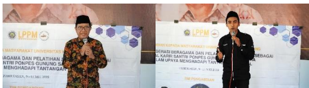
Gambar 5. Sambutan oleh Pengasuh Pondok dan Ketua Tim Pengabdian Universitas Negeri Malang

Program Insan Berdaya diselenggarakan secara luring selama dua hari pada tanggal 10-11 Mei 2025 di Pulau Madura, tepatnya di Aula Pondok Pesantren Nurul Yaqin Gunung Sari. Kegiatan ini dihadiri oleh Pengasuh Pondok Pesantren, Kepala Pondok Pesantren, Kepala Raudhatul Athfal – Madrasah Aliyah Nurul Yaqin, tim pengabdian Universitas Negeri Malang berjumlah 5 orang (1 dosen dan 4 mahasiswa), serta melibatkan kurang lebih 79 peserta yang terdiri dari 36 santri jenjang madrasah aliyah dan 13 guru pada hari pertama, sedangkan pada hari kedua melibatkan 25 santri jenjang madrasah aliyah dan lima guru. Program ini dilakukan dalam beberapa rangkaian acara. Pada hari pertama, diawali dengan acara pembukaan, sambutan berisi urgensi dan harapan dilaksanakannya program Insan Berdaya di Pondok Pesantren Nurul Yaqin Gunung Sari, serta penyerahan simbolisme antar pihak penyelenggara dengan mitra.