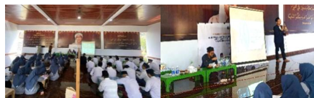
Gambar 7. Penyampaian Materi Moderasi Beragama, Jenis-Jenis Microsoft Office , dan AI

Materi life skill yang pertama ialah jenis-jenis microsoft office dan pemanfaatan AI, sebelumnya peserta dibagi menjadi beberapa kelompok sesuai jumlah laptop untuk melakukan praktik penggunaan prompt AI. Selama praktik berlangsung, seluruh santri terlibat aktif mengikuti arahan pemateri. Santri menyatakan bahwa AI membuat mereka termotivasi untuk mendapatkan banyak pengetahuan dan informasi dengan efisien dan fleksibel. Hal ini sesuai dengan tujuan diciptakannya teknologi AI yaitu memberikan peluang untuk meningkatkan efisiensi, produktivitas, dan kualitas hidup manusia (Masrichah, 2023).